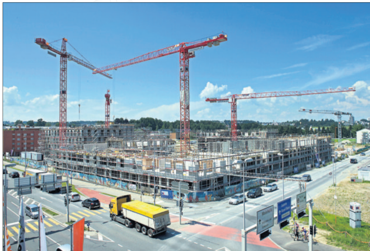
Das ehemalige Schindlerdörfli ist verschwunden – nun entsteht ein ganz neues Quartier.